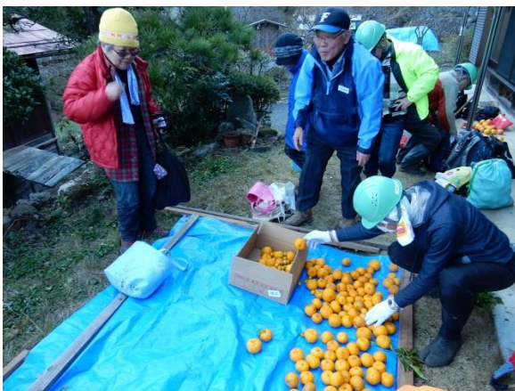
最後は段ボールで