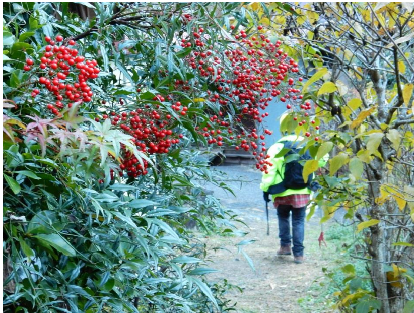
13時、リュックに柚子をいっぱい詰め、山を下る。

収穫した柚子は里仁会Sさん宅の庭をお借りし、仕分け。皆にお土産が出来ました。900~1000個はありそうです。