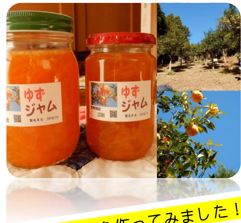
早速、ゆずジャムを作ってみました！