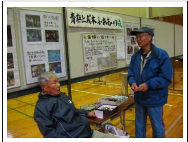
長老のお話も聞きました。大正生まれ！とのこと。