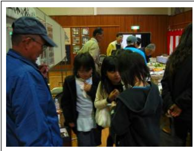
やっぱり女の子に人気の小枝アクセサリーでした。

今年は専用コーナーをいただき、私たちの活動の様子をパネル展示。春の青梅ふくし祭りで人気だった小枝のペンシルアクセサリーも再演しました。ここでも大人気で、ストックがはけてしまい、急遽増産となりました。(どこかの自動車会社とは大違い)