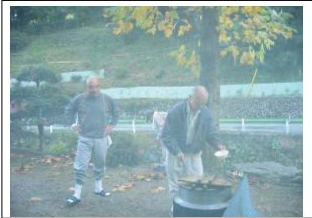
この大なべで作りました。網戸越しで変な色ですが...

すっかり定番になった具沢山の芋煮鍋を楽しみました。今日は、東京ココカラさん協賛のグリーンシップ活動に加わり、森の中で半日を過ごした後なので、冷えた体に熱々が沁みます。