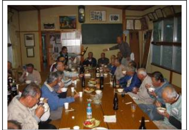
どこか懐かしい味で、いくらでも入ります。